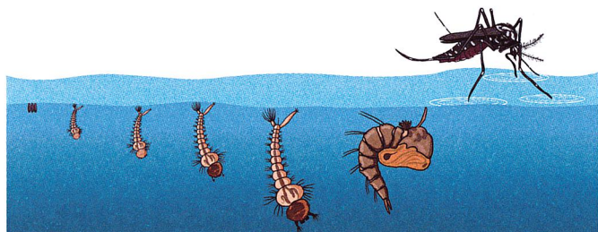
Entwicklungszeit etwa 1 Woche

Tigermücken legen ihre Eier in stehenden Gewässern ab. Die Eier sind über mehrere Monate trockenresistent. Bei sommerlichen Temperaturen entwickeln sich die Eier im Wasser innerhalb von etwa einer Woche zu geschlüpften Mücken. In dieser Phase muss man ansetzen, um die Vermehrung der Tigermücke zu unterbinden.